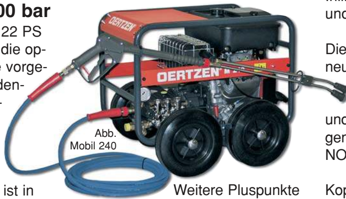
Abb. Mobil 240

Drei Modelle mit 14 und 22 PS Antriebsleistung sichern die optimale Anpassung an die vorge-sehene Aufgabe: Fassaden-reinigung, Wasser-Sand-strahlen, Betoninstand-setzung oder Rohr-reinigung.