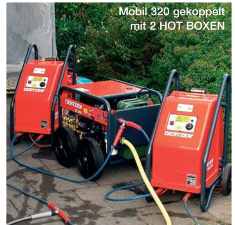
Mobil 320 gekoppelt mit 2 HOT BOXEN